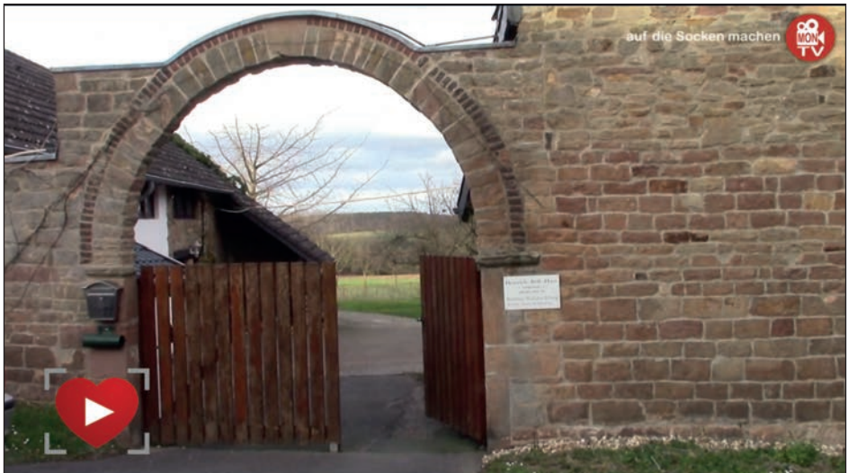
Das Böll-Haus in Langenbroich.

Das Böll-Haus ist kein Museum. Denn in erster Linie soll es ein Hort der Ruhe, der Arbeit, aber auch Sicherheit für Künstler und auch Journalisten sein.