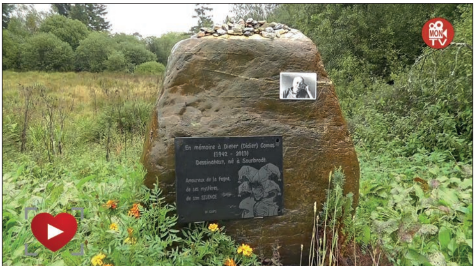
Ein Denkmal im Hohen Venn erinnert an den Comiczeichner Didier Comès.

Etwas Biografisches: Als der Comic-Autor 1942 geboren wurde, war das belgische Sourbrodt von Deutschland besetzt – sein Vorname war Dieter Hermann. Nach Ende der Besatzung wurde sein Name zu Didier geändert. Weggefährten erinnern sich aber, dass er auch später von vielen Freunden Dieter genannt wurde.